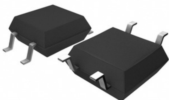
Image nümayəndəlik ola bilər. Məhsul detalları üçün spesifikasiyalara baxın.